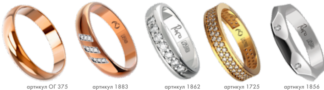
артикул 0Г 375

* Срок приема заявок на участие в акции с 15.04.2012 по 15.09.2012. Сроки стимулирующей лотереи с 15.04.2012 по 27.09.2012. Вся информация о правилах проведения стимулирующей лотереи «Обручальный марафон 2012», количестве призов и их стоимости, порядке розыгрыша, сроках, месте и порядке их получения – на интернет-сайте www.ringo.info или по телефону +7(343) 359 89 08. Организатор стимулирующей лотереи ЗАО «Производственно-коммерческая фирма «ЭРМИ», 620041, Екатеринбург, Уральская, д.3. ИНН/КПП: 6663061168/666301001. ОГРН 11026603629907