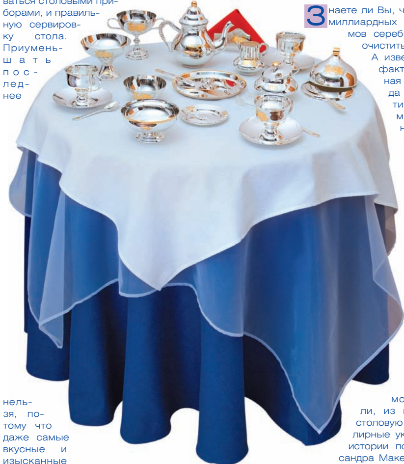
Стол, сервированный для завтрака серебряными приборами серебра 925*

Вашей памяти на долгие годы, особенно если свадебные бокалы для этого события отличаются своей роскошью и изящностью. Свадебный набор из серебряных бокалов и подноса станет впоследствии отличным напоминанием о замечательном и волнующем дне.