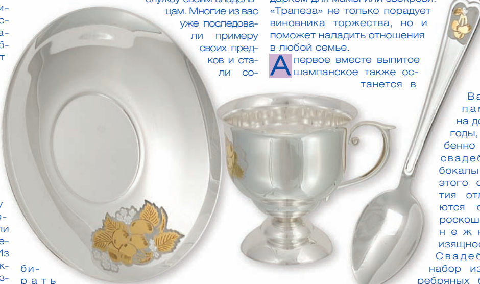
Чайная пара и ложка из коллекции «Вишневый сад» серебра 925*, золочение

брать коллекцию из столового серебра. В наших магазинах Вам всегда вниманию представлены серебряные столовые наборы, включающие в себя различное количество предметов – это дает возможность выбрать именно то, что нужно. Здесь есть наборы как на одну персону, выполненные в строгом, лаконичном стиле, так и большие наборы на 12 персон, состоящие из нескольких десятков предметов. Но каждый такой столовый набор – это рождение фамильной ценности, передающейся из поколения в поколение. Серебряные столовые наборы от компании «АЛМАЗ-ХОЛДИНГ» – великолепный стиль, вековые традиции ювелиров и разумная стоимость. Именно так рождаются фамильные ценности.