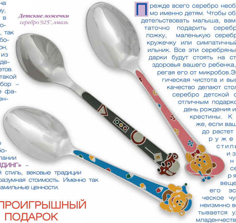
Детские ложечки серебра 925*, эмаль

Прежде всего серебро необходимо именно детям. Чтобы облагодетельствовать малыша, вам достаточно подарить серебряную ложку, маленькую серебряную кружечку или симпатичный поильник. Все эти серебряные подарки будут стоять на страже здоровья вашего ребенка, оберегая его от микробов. Экологическая чистота и высокое качество делают столовое серебро детской серии отличным подарком на день рождения или на крестины. К тому же, если ваше чадо растет в окружении стильных и изящных серебряных вещей – его эстетическое чувство неизменно воспитывается уже с младенчества. ☺