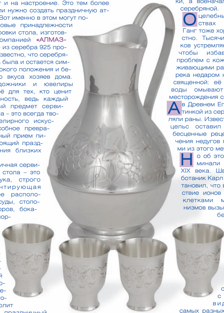
«Набор для воды» серебра 925*, ручная гравировка

В революционное время винные сервизы из серебра были практически в каждой