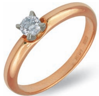
Помолвочные кольца Золото 750°, бриллианты.