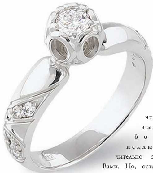
Помолвочные кольца Белое золото 585°, бриллианты.