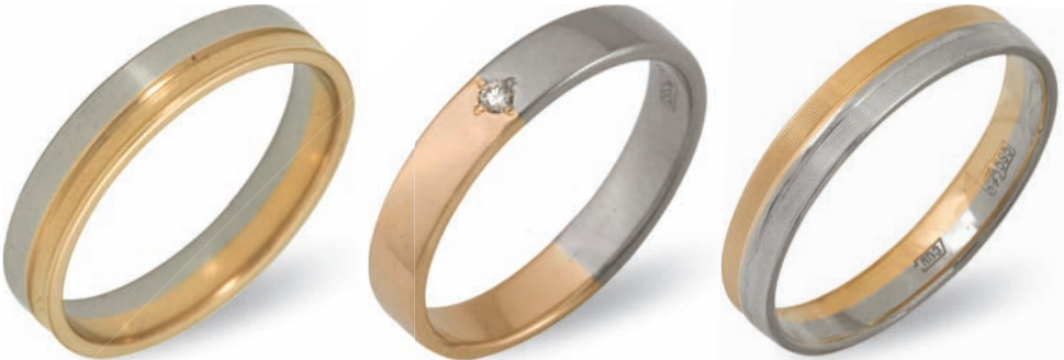
Обручальные кольца «Вместе навсегда»

Есть приятный практический довод в пользу постоянного ношения обручального кольца. Как утверждают специалисты по акупунктуре, обручальное кольцо на безымянном пальце воздействует на точки, которые отвечают за работу половой системы. Так, молодые обрекают себя