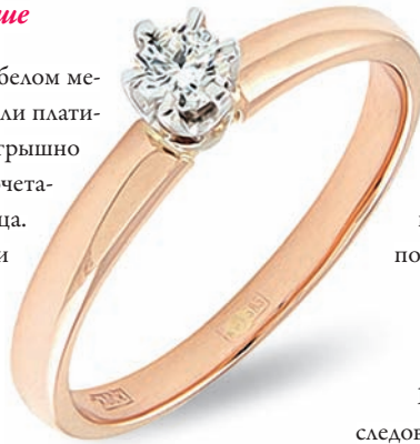
Помолвочные кольца Золото 585, бриллианты.

Кольцо для помолвки, выполненное в жёлтом или даже розовом золоте может смотреться неожиданно оригинально и интересно. Розовое