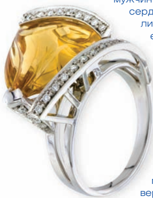
Кольцо с цитрином золото 750°, цитрин в форме триллиона, бриллианты