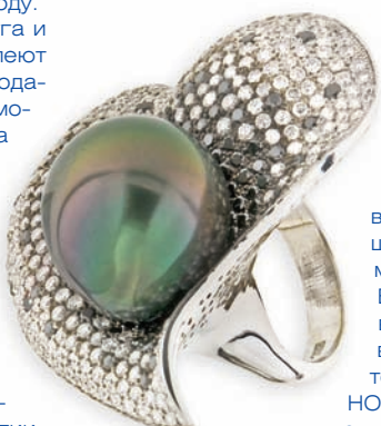
Кольцо «С чистого листа» золото 750°, чёрные и белые бриллианты, таитянский жемчуг

Кольцо «С чистого листа» (белое золото 750°, чёрные и белые бриллианты, чёрный грушевидный таитянский жемчуг) художник А.С.Теплинская придала фантастическую форму, напоминающее рождение планеты в космосе. Оно способно очаровать не только натуру, увлекающуюся астрологией и мистицизмом, но и аристократическую особу, остро чувствующую стиль и гармонию форм). А гарнитур «Элит» (золото 750°, бриллианты, серый жемчуг, родоли-