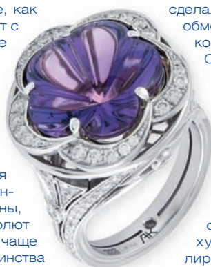
Кольцо с аметистом золото 750°, аметист, бриллианты

Любовь может по-разному проявляться от нетерпимости и желания немедленно мчаться в ЗАГС до внутренней тишины, благоговения и нежности. А если и глаголют уста, то лишь от избытка сердца. Впрочем, чаще от этого глаголют женские уста, а у большинства мужчин от избытка сердца только лицо наливаясь кровью