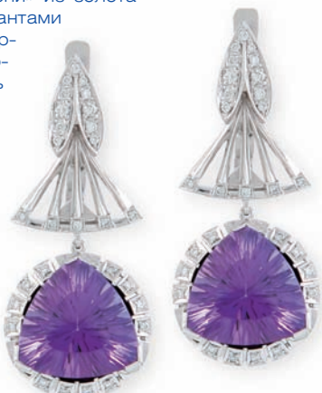
Серьги из гарнитура «Кокетка» золото 750°, аметист в форме триллиона, бриллианты