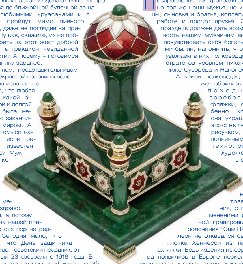
Письменный набор золото 750°, нефрит, эмаль, рубины, бриллианты, хромдиоксид