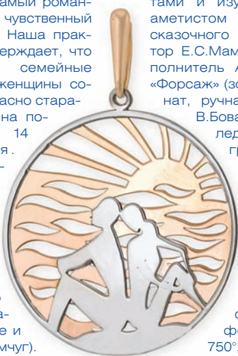
Подвеска «Валентинка» золото 585°, частичное родирование

Кольцо «С чистого листа» (белое золото 750°, чёрные и белые бриллианты, чёрный грушевидный таитянский жемчуг) художник А.С.Теплинская придала фантастическую форму, напоминающее рождение планеты в космосе. Оно способно очаровать не только натуру, увлекающуюся астрологией и мистицизмом, но и аристократическую особу, остро чувствующую стиль и гармонию форм). А гарнитур «Элит» (золото 750°, бриллианты, серый жемчуг, родоли-